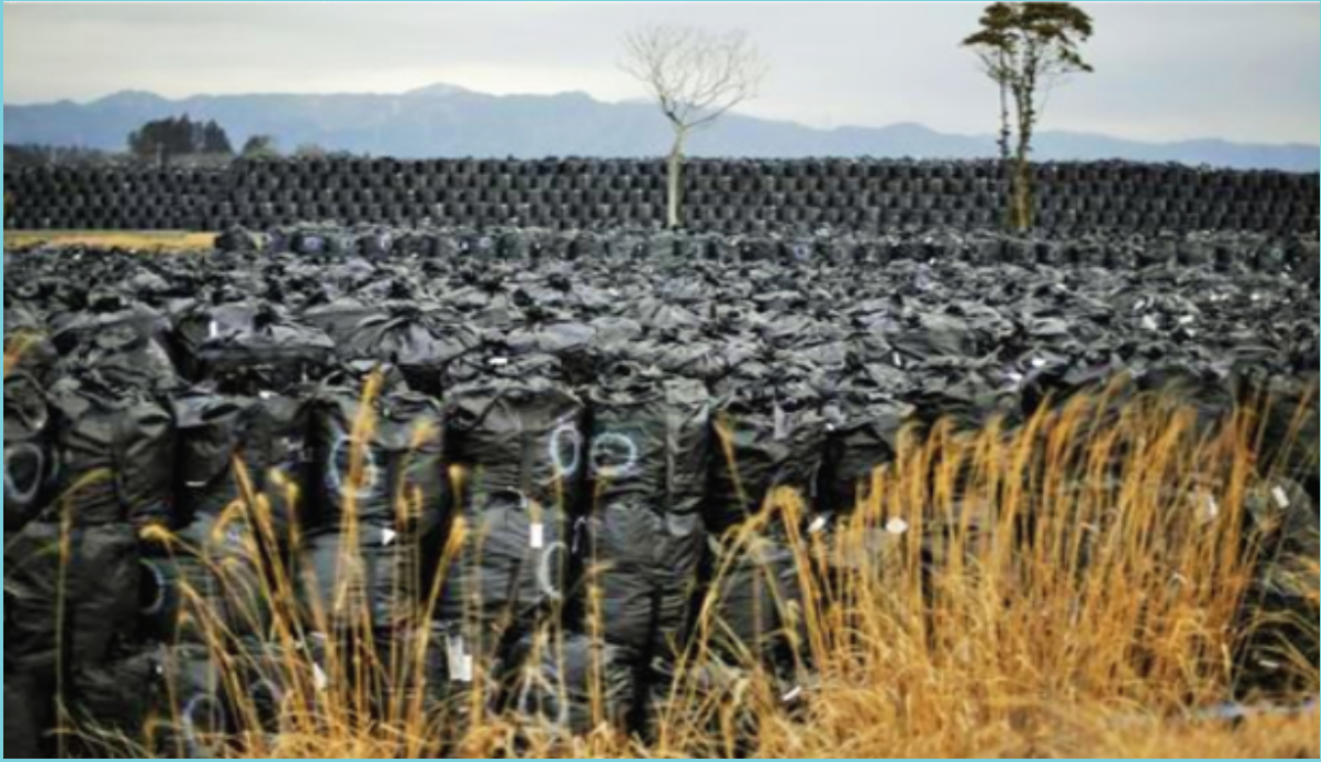
3 paveikslas. 30 mln. tonų radioaktyviųjų atliekų sukaupta per 5 metus.