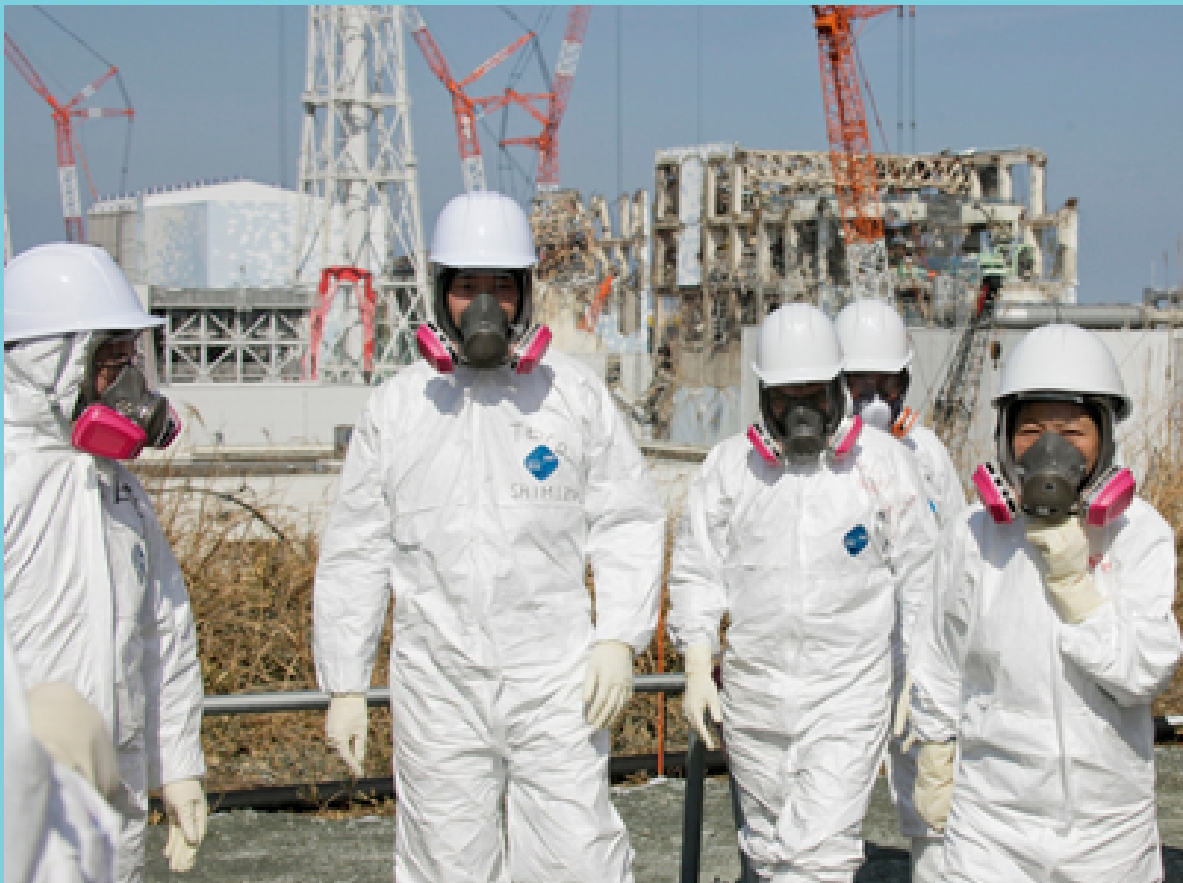
Fukušimos AE avarijos likviduotojai.

2011 m. gegužės mėn. duomenimis, avarijos padarinius likvidavo apie 8 tūkst. darbuotojų. Remiantis TEPCO informacija, vidutinė avariją likvidavusių darbuotojų apšvitos dozė per pirmuosius 19 mėn. po avarijos buvo apie 12 mSv. Tuo laikotarpiu apie 35 proc. darbuotojų gavo didesnes nei 10 mSv dozes, o 0,7 proc. – nuo 100 iki 250 mSv. Pagal UNSCEAR atliktą vertinimą, 12 darbuotojų skydliaukės sugertosios dozės (daugiausiai dėl įkvėpto radioaktyviojo jodo) svyravo nuo 2 iki 12 Gy. Darbuotojai, kurie patyrė didesnę nei 100 mSv apšvitos dozę, registruoti ilgalaikiai sveikatos stebėsenai. Labiausiai tikėtina, kad sveikatos problemų dėl avarinės apšvitos gali kilti asmenims, patyrusiems 100 mSv ar didesnę apšvitą per trumpą laiką. Tokią apšvitą patyrė 160 atominės elektrinės darbuotojų, jiems iki šiol vykdoma ilgalaikė sveikatos stebėseną.